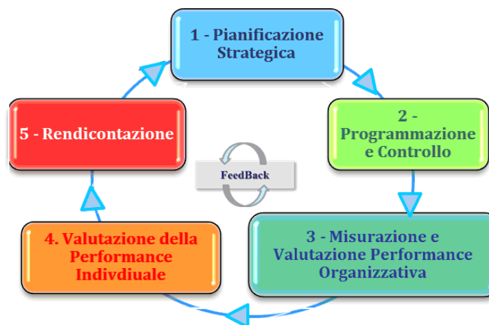
Fig.1 – Ciclo della performance