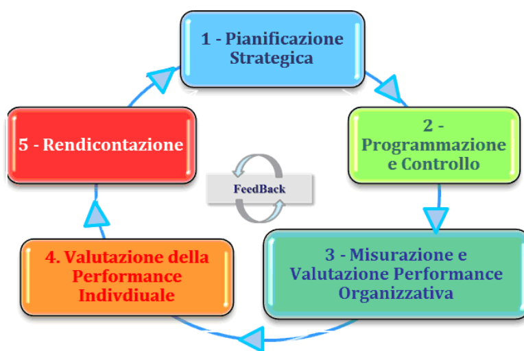
Fig.1 – Ciclo della performance

Assume, quindi, una fondamentale importanza il nesso tra la strategia di Ateneo e il ciclo della performance: il rapporto tra strategia e performance si esplica come collegamento tra la prospettiva politica di sviluppo dell'Ateneo, esplicitata nel piano strategico, e le azioni gestionali da implementare per la realizzazione dei risultati attesi, contenute nel piano integrato.