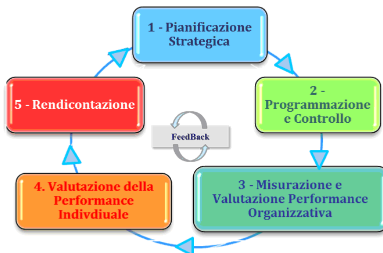
Fig.1 – Ciclo della performance

Assume, quindi, una fondamentale importanza il nesso tra la strategia di Ateneo e il ciclo della performance: il rapporto tra strategia e performance si esplica come collegamento tra la prospettiva politica di sviluppo dell'Ateneo, esplicitata nel piano strategico, e le azioni gestionali da implementare per la realizzazione dei risultati attesi, contenute nel piano integrato.