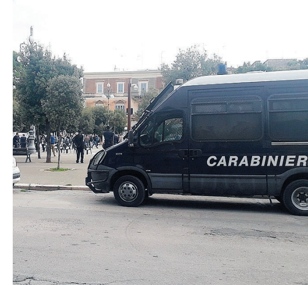
SCONFORTE E CONTROLLI Alcuni manifestanti controllati dai carabinieri

BISCEGLIE. Sotto un raro sole novembre, ieri mattina, la categoria dei ristoratori di Bisceglie è scesa nella piazza del Palazzuolo per esprimere disappunto verso i penalizzanti e continui decreti emanati dal presidente del Consiglio dei ministri, Conte, con misure che mettono in ginocchio un ventaglio di attività cardine dell'economia e del lavoro. I ristoratori biscegliesi, riuniti nell'Assolocali, associazione organizzatrice del sit-in che ha come riferimento la Confcommercio, hanno voluto manifestare pacificamente la loro forte preoccupazione per la crisi economica che galoppa, per il futuro incerto, tra tasse e licenziamenti. In sostanza è un modo per far sentire la propria voce e chiedere iniziative di sostegno.