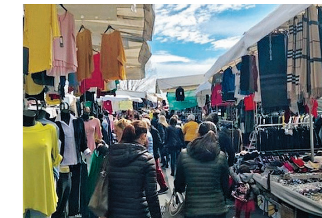
COMMERCIO Si mobilitano gli ambulanti

ANDRIA. In attesa di conoscere le prossime misure contenute nel prossimo Decreto della Presidenza del Consiglio dei Ministri la categoria dei commercianti ambulanti è in stato di agitazione. Temo, infatti, pesanti restrizioni alle attività mercatali.