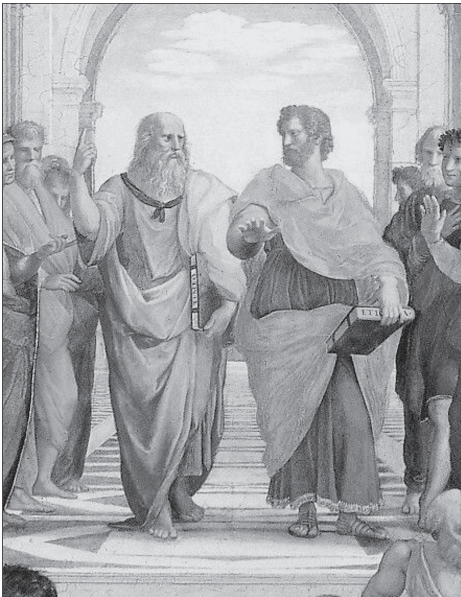
Raffaello, La scuola di Atene , particolare dell'affresco (770x500 cm circa) datato al 1509-1511, situato nella Stanza della Segnatura all'interno dei Palazzi Apostolici , nella Città del Vaticano