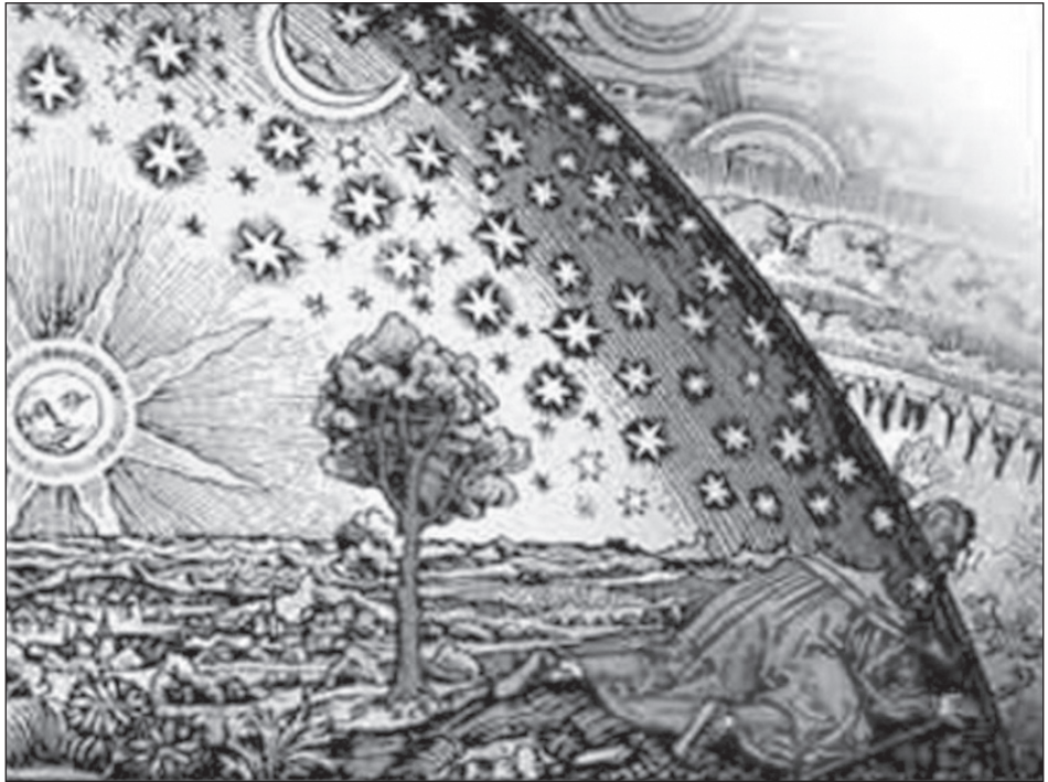
Dal mondo chiuso all'universo infinito?