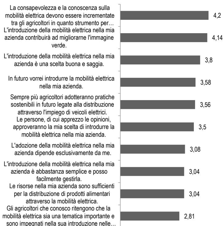
Fig. 2 – Fattori che influenzano la mobilità elettrica tra gli operatori della filiera corta