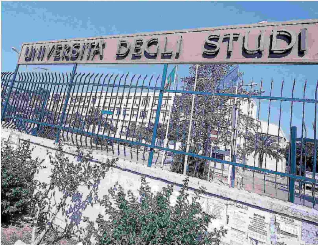
La corsa per il Rettorato. A due mesi dal voto i candidati fanno parlare i loro programmi