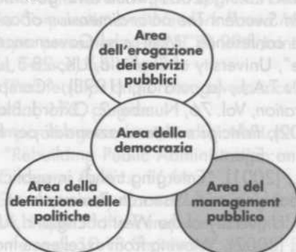
Figura 3 – Le aree di governance pubblica

Una terza implicazione operativa, infine, riguarda gli sforzi di innovazione delle aziende e amministrazioni pubbliche. I soggetti che promuovono strategie di cambiamento devono saper presidiare in maniera coerente le diverse aree di governance pubblica (figura 3) e non limitarsi ad affrontare il solo ambito del management interno.