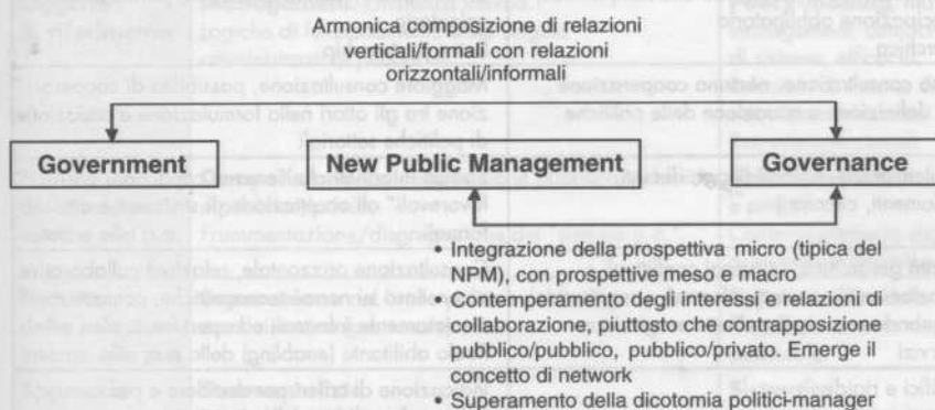
Figura 1 – La concettualizzazione della governance come ampliamento del "government" e del NPM

In primo luogo, la governance viene spesso intesa come un concetto più ampio (Kooiman) – e per alcuni addirittura sostitutivo – di quello di government (tabella 5) (Rhodes, Schick, Kooiman, van Vliet, Björk, Johansson, Borgonovi, Pierre) (26).