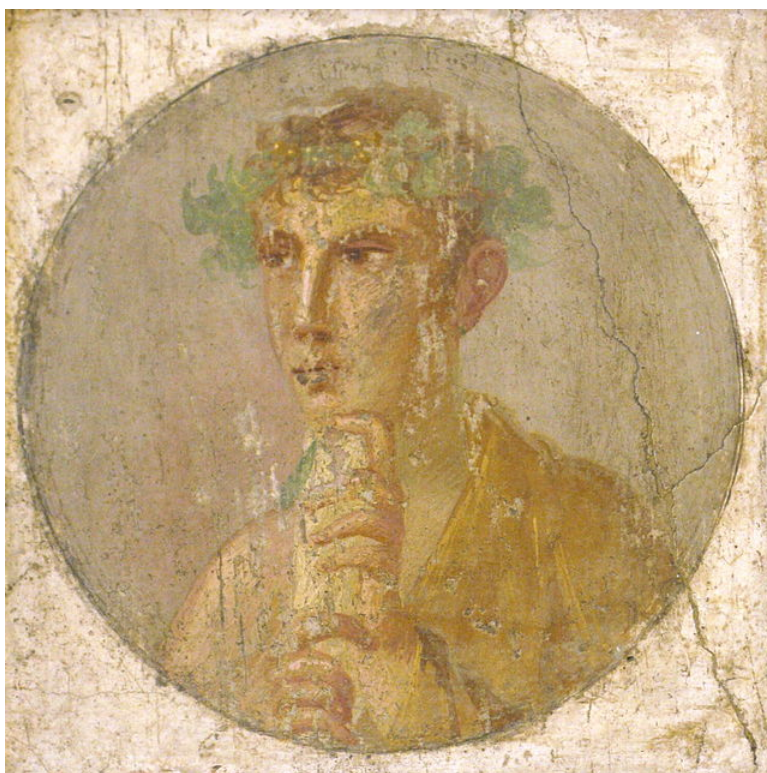
Fig. 4 Ritratto di giovane con rotulus , 55-79 d.C. da Pompei, regio VI, insula occidentale Museo Archeologico Nazionale di Napoli