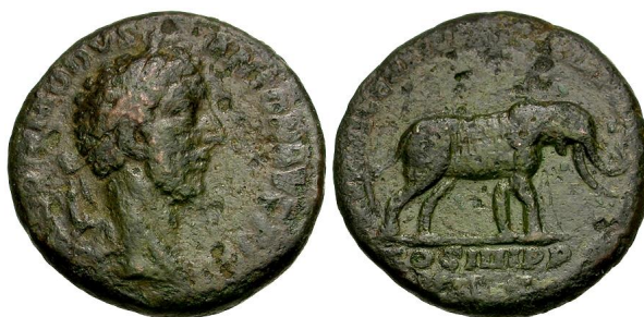
Fig. 2: moneta bronzea di Commodo, 183-184 d.C. ( http://numismatics.org/ocre/id/ric.3.com.432 )