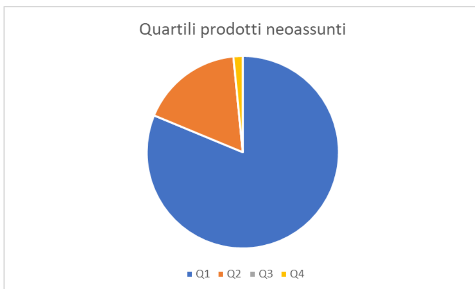
Figura 3. Distribuzione per quartile della produzione scientifica 2021 dei neoassunti nel biennio 2020-2021