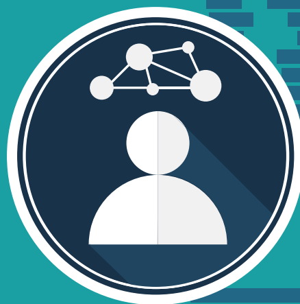
specialista SEO E WEB