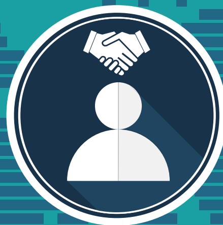
specialista JOB MARKETING