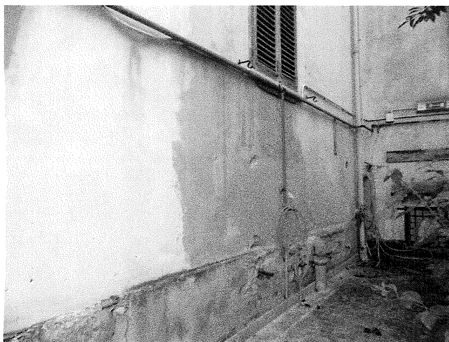
Foto 2 - Cortile interno