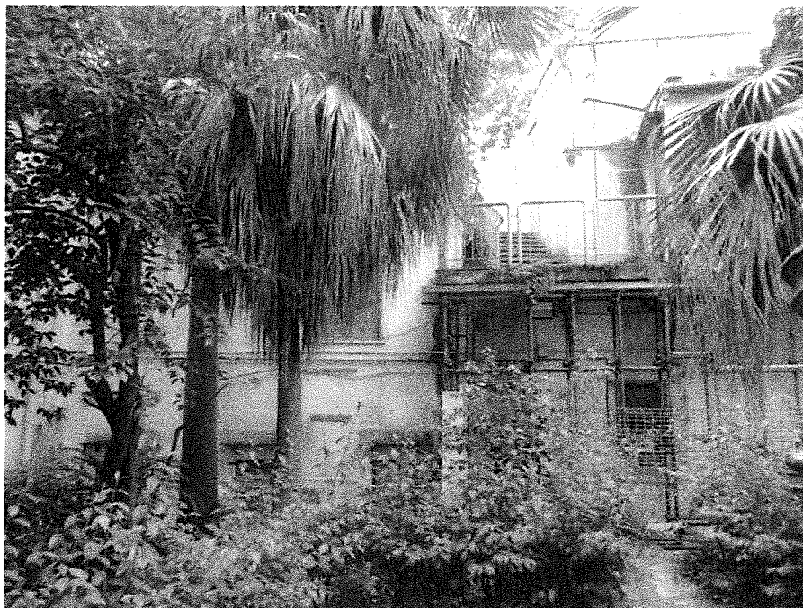
Foto 1 - Cortile interno