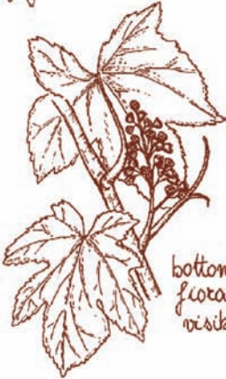
bottoni floreali visibili