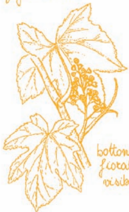
bottoni fiorali visibili